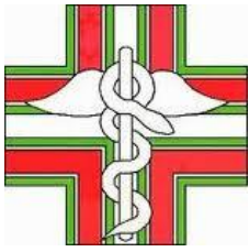
Ordine dei Farmacisti